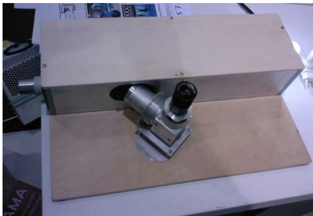
Lo spettroscopio alla Fiera di Ancona

La spettroscopia è l'analisi delle radiazioni elettromagnetiche che ci ha permesso di conoscere la composizione chimica e fisica delle stelle, nonché di lanciare uno sguardo sulle regioni più lontane dell'Universo che ci inviano la luce e altre radiazioni elettromagnetiche, dalle deboli onde radio ai potenti raggi gamma. Il primo a rilevare che la luce poteva essere scomposta nei suoi componenti è stato Newton, che facendola passare in un prisma era riuscito a deviare e separare i fasci di luce colorati, così come accade nel comune fenomeno dell'arcobaleno.