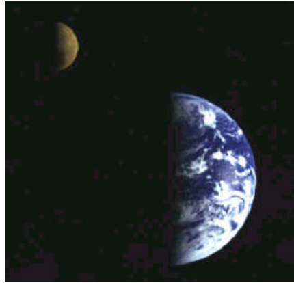
Terra e Luna riprese dalla sonda Galileo nel 1992

Una caratteristica comune tra i due sistemi è data dal fatto che per entrambi i satelliti, Luna e Caronte, il periodo di rivoluzione è uguale al periodo di rotazione. Essi perciò rivolgono la stessa faccia al rispettivo pianeta. Tale periodo è di circa 29,5 giorni per la Luna e di 6,39 giorni per Caronte. Inoltre il periodo di rotazione di Plutone è anch'esso di 6,39 giorni, perciò Plutone e Caronte si rivolgono reciprocamente sempre la stessa faccia, mentre per la Terra e la Luna il fenomeno non è reciproco avendo la Terra un periodo di rotazione