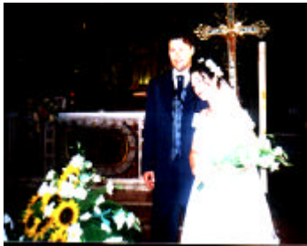
Altro che telescopio!! Auguri!!!